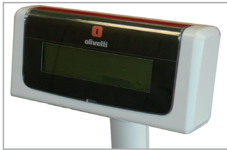
Display cliente grafico remotizzato