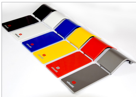
Design moderno e look personalizzabile