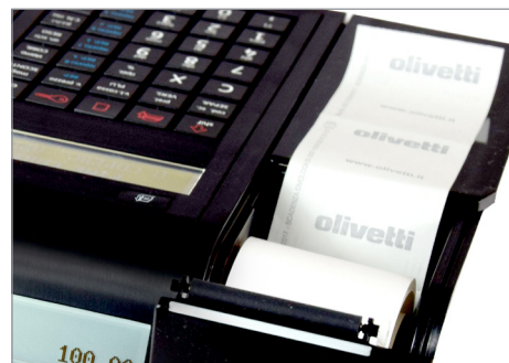
Inserimento rapido e agevole del rotolo carta